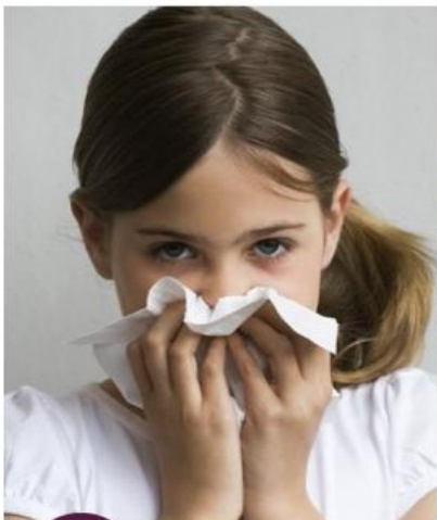
Κάλυψε με χαρτομάντιλο τη μύτη και το στόμα σου, όταν φτερνίζεσαι ή βήχεις.